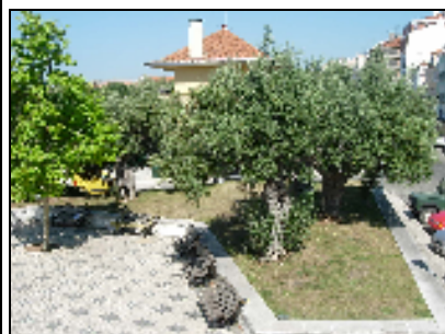
Conjunto de quatro oliveiras

Estas oliveiras constituem memória dum antigo local de culto, romaria, devoção popular e da ocupação agrícola anterior à moderna expansão da cidade, tendo-lhes sido atribuído interesse cultural, pedagógico e paisagístico.