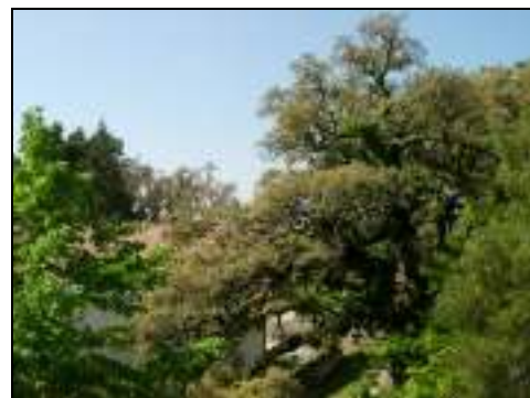
Árvores na envolvente à Capela de S. Silvestre

Estes exemplares localizam-se na envolvente da Capela de S. Silvestre, importante local de culto e romaria.