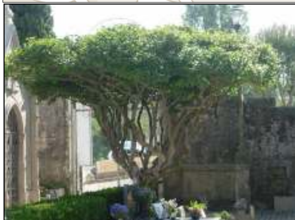
Camellia japonica (cameleira)

Árvore centenária de grande simbolismo e devoção por estar situada no cemitério.