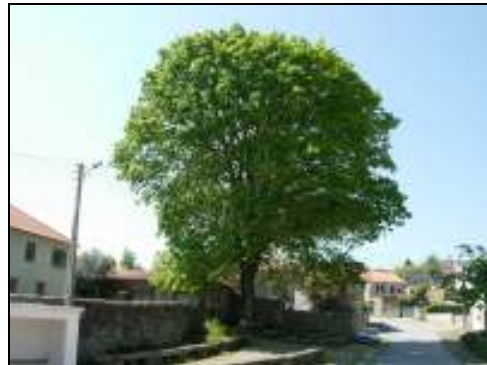
Quercus rubra L.

Árvores de grande valor ornamental e paisagístico, que se situam num jardim público, próximo da Igreja, constituindo uma forte referência visual e vivencial de várias gerações da população local.