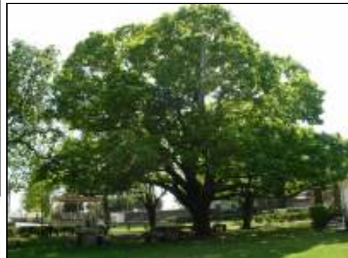
Castanea sativa Miller

DIRECÇÃO - GERAL DOS RECURSOS FLORESTAIS