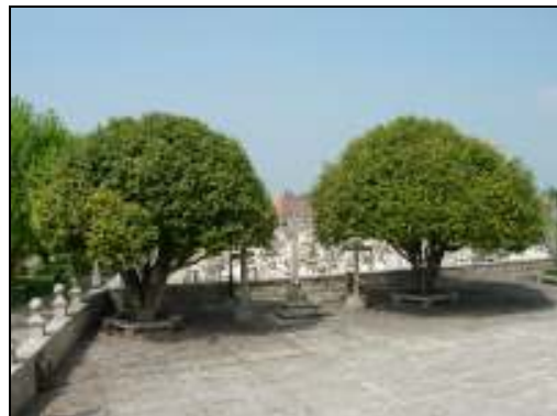
Camellia japonica Thunb (dois exemplares)

Exemplares de grande beleza, implantados no adro da Igreja.