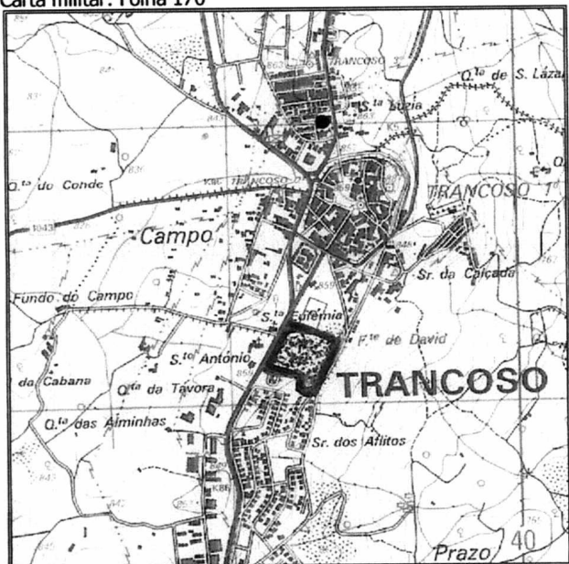
Carta militar: Folha 170

centro histórico da vila de Trancoso, pertencente à Câmara Municipal de Trancoso: