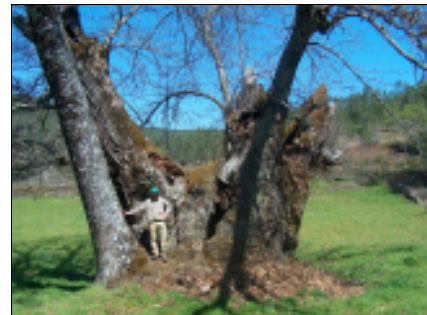
Castanea sativa Miller

Árvore de porte notável considerada um dos castanheiros com maior perímetro do tronco existente em Portugal.